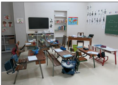
Dans des locaux commerciaux réaménagés de 250 m 2 Accès au city-stade des Bas-Coquarts pour les récréations