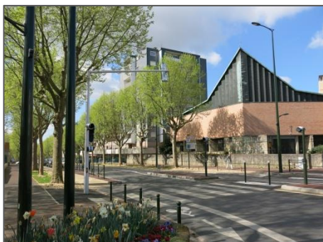
L'école est située résidence Normandie A côté de l'église de la Pentecôte

Elle est gérée par une association Loi de 1901 à but non lucratif.